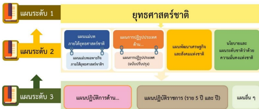
แผนภาพที่ 1-1 ภาพรวมความเชื่อมโยงของแผน 3 ระดับ

การดำเนินงานเพื่อขับเคลื่อนการพัฒนาเศรษฐกิจและสังคมของประเทศก่อนที่จะมีการประกาศใช้ยุทธศาสตร์ชาติ 20 ปี (พ.ศ. 2561 – 2580) ได้อาศัยแผนพัฒนาเศรษฐกิจและสังคมแห่งชาติ เป็นแผนหลักเพื่อ เป็นกรอบในการวางแผนปฏิบัติราชการและแผนในระดับปฏิบัติต่างๆ รวมถึงการจัดทำค่าของงบประมาณ รายจ่ายประจำปีให้มีความสอดคล้องเชื่อมโยงกัน แผนพัฒนาเศรษฐกิจและสังคมแห่งชาติฉบับที่ผ่านๆ มา จึงมีลักษณะการกำหนดประเด็นการพัฒนาประเทศในภาพกว้างที่ครอบคลุมทุกมิติ เพื่อให้หน่วยงานภาครัฐ ทุกระดับสามารถเชื่อมโยงภารกิจและจัดทำแผนปฏิบัติราชการและค่าของงบประมาณให้อยู่ภายใต้กรอบ การสนับสนุนเป้าหมายของแผนพัฒนาฯ การพัฒนาประเทศภายใต้แผนพัฒนาฯ ฉบับที่ผ่านมามีให้ ความสำคัญกับมิติการพัฒนาประเทศทุกด้านอย่างเท่าเทียมและสมดุลกัน โดยจุดเน้นของแต่ละยุทธศาสตร์ การพัฒนาจะมุ่งเน้นการบรรลุเป้าหมายการพัฒนาแต่ละด้านเป็นหลัก เพื่อมุ่งหมายให้ผลสัมฤทธิ์ที่เกิดขึ้น จากการขับเคลื่อนการพัฒนาของแต่ละมิตินำไปสู่การบูรณาการผลรวมที่สนับสนุนการดำเนินงานซึ่งกันและกัน และส่งผลให้ประเทศบรรลุเป้าหมายในภาพใหญ่ที่กำหนดขึ้นภายใต้แผนพัฒนาฯ ได้